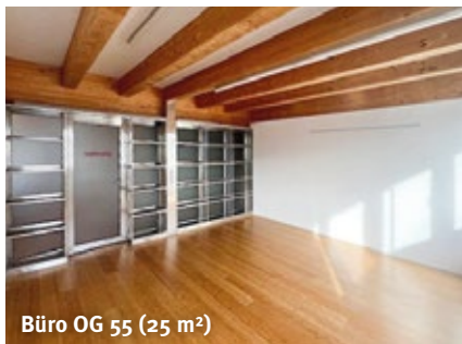
Büro OG 55 (25 m 2 )