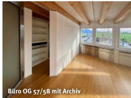
Büro OG 57/58 mit Archiv