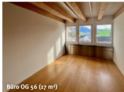
Büro OG 56 (17 m 2 )