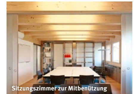
Sitzungszimmer zur Mitbenützung