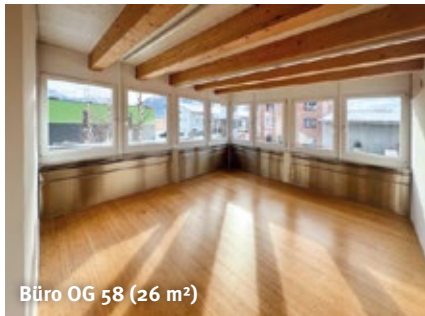
Büro OG 58 (26 m 2 )

Mitbenützung der Infrastruktur wie WC, Küche, grosses Sitzungszimmer, etc.