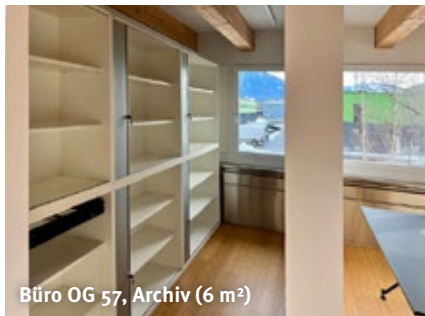
Büro OG 57, Archiv (6 m 2 )